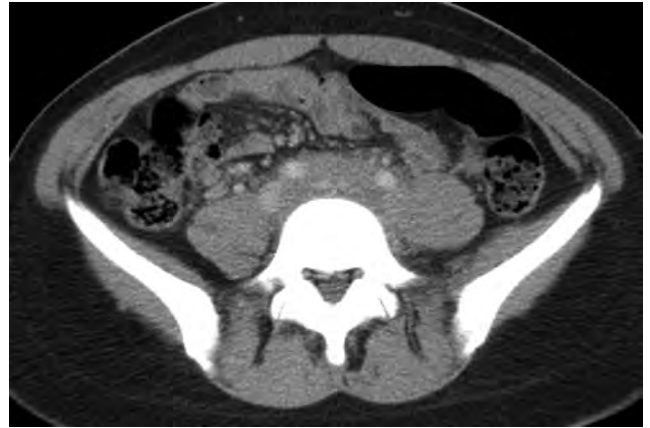
FIGURA 1. Mase adenopatic retroperitoneale cu înglobarea vaselor mari; tromboză de venă femurală și iliacă stângă, aspect CT

pancreatice (Fig. 2); mase tumorale localizate la nivelul regiunii fesiere stângi și perianale extinse în grăsimea ischioanală bilateral (Fig. 3); colecist cu conținut neomogen, cu microcalculi declivi și structură osoasă neomogenă, cu multiple leziuni nodulare confluențe, oasele femurale și ale bazinului fiind interesate aproape în totalitate.