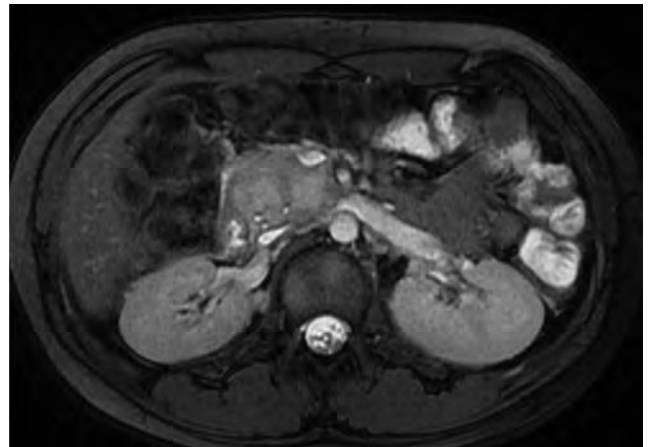
FIGURA 2. Bloc adenopatic cap pancreas, aspect RMN