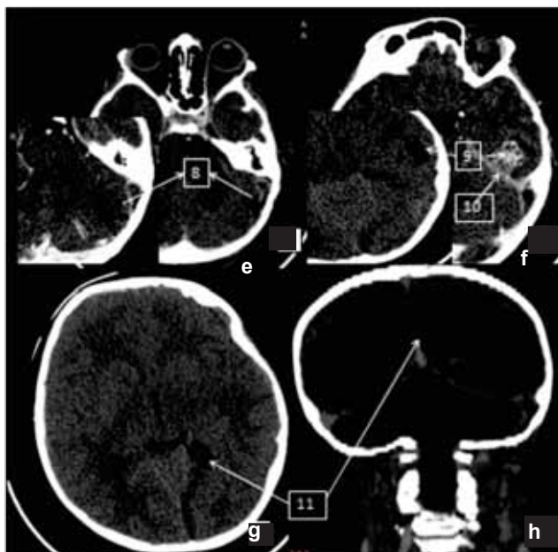
Figura 1B. Examinare CT craniu

e – reconstrucții de 2,5 mm, axiale de fosă posterioară în fereastra de parenchim cu substanță de contrast intravenos; f – reconstrucții axiale nativ și post-administrarea contrastului intravenos la nivel temporal în fereastra de parenchim; g – secțiune axială nativă la nivel supratentorial; h – reconstrucție coronală post injectare contrast intravenos