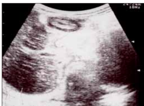
FIGURE 1. Abdominal US: round-oval 4,5 cm image, with “rosette” aspect, presenting a transonic halo and own hyperechogenic wall (DD)

At admission, the child had an influenced general condition, high fever (40o), pale teguments with slightly diminished elasticity, intensely congested pharynx with pultaceous exudates on both amygdalae, marked psychomotor agitation. The paraclinic investigations carried out reveal important leukocytosis with neutrophilia (WBC=18940/mmc, NEU=72,2%), intense inflammatory syndrome (ESR=68 mm/h, Fg=736mg/dl). The abdominal ultrasound reveals a round-oval 4,5 cm image, with “rosette” aspect, presenting a transonic halo and own hyperechogenic wall, slightly swelled, similar to a duodenum image (Figure 1).