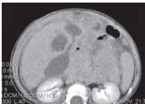
FIGURE 2. Abdominal CT: multiple liquid subhepatic images in the large peritoneal cavity and on the flanks

Severe post operative evolution with febrile ascensions, influenced general condition, purulent and even hemorrhagic drainage; food and bilious vomiting is added. The ultrasound reveals both the round-oval image, well defined, with own wall, described at the previous examinations, and the occurrence of a new hypoechogenic area imprecisely defined, over the 4th hepatic segment. A new CT reveals multiple liquid subhepatic images in the large peritoneal cavity, on the flanks and into the Douglas' pouch. (Figure 2).