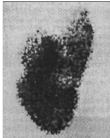
Figura 3 99mTc DMSA renal scan incidentă posterioară. Cicatrice renale cu pierdere de cortex funcțional la nivelul polului superior și al zonei medii a rinichiului stâng

Cicatricile renale inițiale modifică anatomia papilelor renale din vecinătate transformând papilele simple în compuse (complexe). Papilele complexe la rândul lor, perpetuează refluxul intrarenal inițial, apărând astfel cicatrice renale noi. Se instalează în acest mod un cerc vicios imediat ce o primă cantitate de urină infectată pătrunde în rinichi. Cicatricile renale apar cel mai frecvent la nivelul polilor renali, unde sunt de altfel situate, în număr mare, papilele concave (complexe). Febra, sexul feminin și întârzierea diagnosticului de RVU sunt considerați factori de risc în apariția cicatricelor renale în special în RVU dilatante (gr. IV și V).