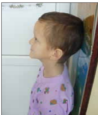
FIGURA 2. Aspect clinic general: microcefalie, hipostatură

Examinările paraclinice: teste biologice uzuale în limite normale; determinările hormonale au confirmat diagnosticul de panhipopituitarism: STH bazal 0,6 ng/ml, STH după stimulare cu insulină 1,03 ng/ml la 30 min (glicemie 40 mg%) și 2,06 ng/ml la 60 minute; TSH 5,7 \mu UI/ml, T4 < 2 \mu g/dl, Cortizol 1,75 \mu g/dl, 17 KS 20,9 mg/24h, 17 OH-CS 1,25 mg/24h, PR 22,19 ng/ml.