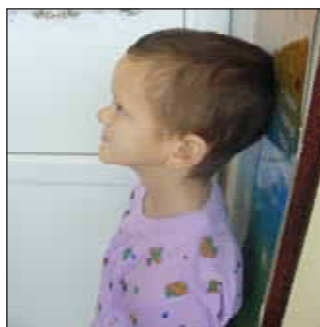
FIGURE 2. Clinical aspect: microcephaly, short stature

nosis of panhypopituitarism: basal STH 0.6 ng/ml, STH after insulin stimulation 1.03 ng/ml at 30 minutes (blood glucose 40 mg%) and 2.06 ng/ml at 60 minutes; TSH 5.7 \mu UI/ml, T4 <2 \mu g/dl, Cortisol 1.75 \mu g/dl, 17 KS 20.9 mg/24h, 17 OH-CS 1.25 mg/24h, PR 22.19 ng/ml.